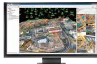
「フルモード」で精密に処理