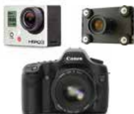
多数のカメラに対応